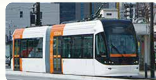
富山ライトレール