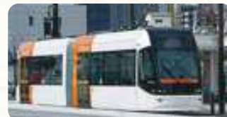
富山ライトレール