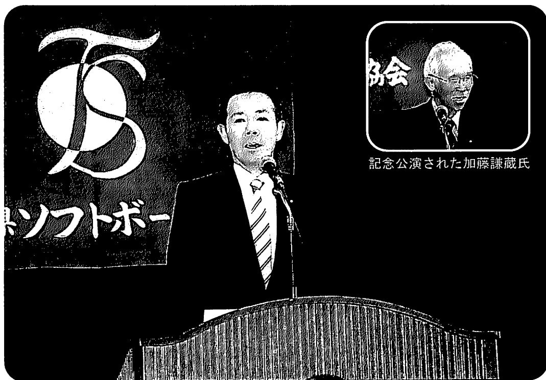
田畑裕明衆議院議員が副会長に就任